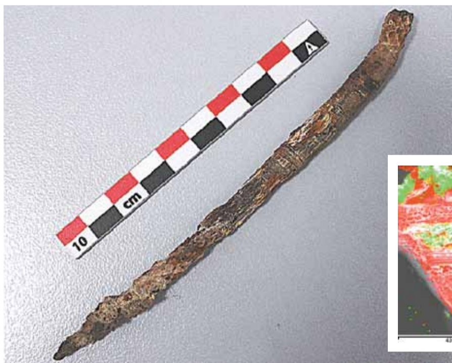
Απεικόνιση των συγκεντρώσεων σιδήρου (με κόκκινο) και ασβεστίου (με πράσινο) σε μικροδείγμα από τις ράβδους

Οι νέες πληροφορίες που προέκυψαν από τις αναλύσεις προσφέρουν πλέον νέα «βάση» για ερμηνείες στους ερευνητές. Τα χαρακτηριστικά