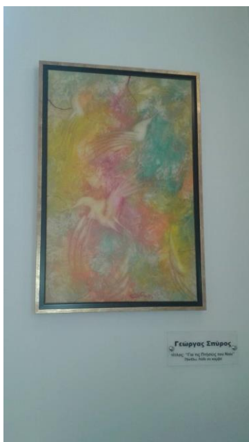
Για τις πτήσεις του Νου

Οι Πρυτανικές αρχές ευχαριστούν θερμά τον (καταγόμενο από το Λυγουριό, Επιδαύρου) καλλιτέχνη για την ευγενική του χορηγία.