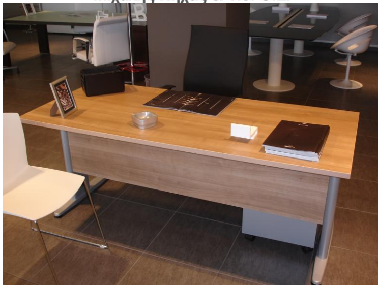
ΤΟ ΓΡΑΦΕΙΟ ΘΑ ΕΧΕΙ ΜΕΤΑΛΛΙΚΗ ΜΕΤΩΠΗ ΣΥΜΦΩΝΑ ΜΕ ΤΑ ΖΗΤΟΥΜΕΝΑ ΤΗΣ ΔΙΑΚΗΡΥΞΗΣ